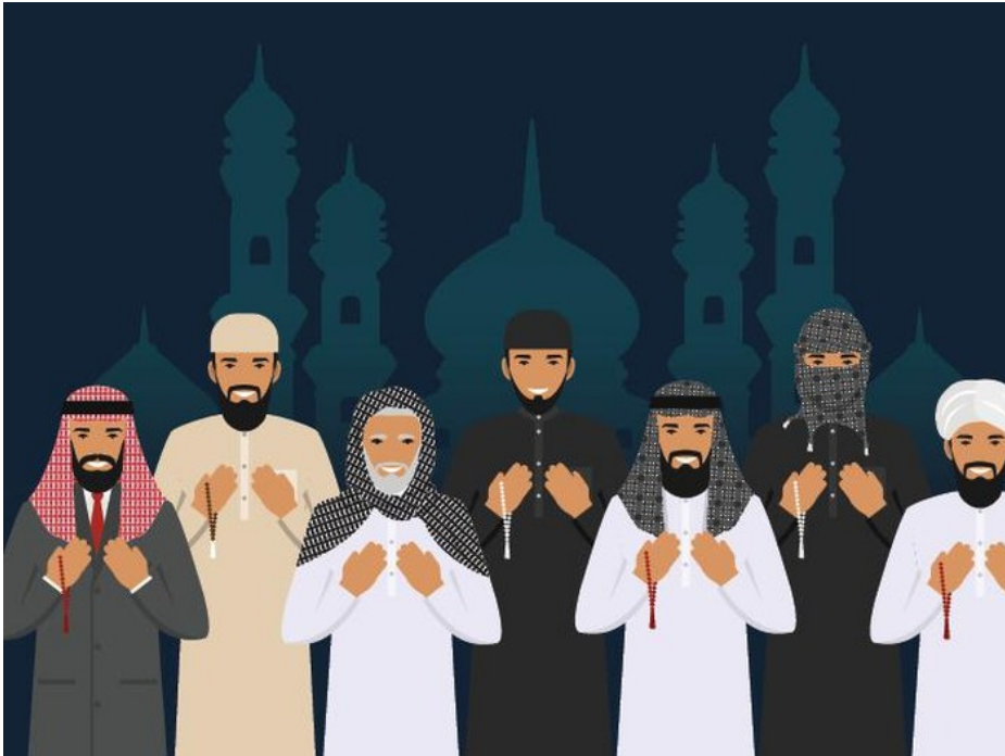
Tentukan Idul Adha 2020, Kemenag Gelar Sidang Isbat 21 Juli

Jakarta - Kementerian Agama (Kemenag) akan menggelar sidang isbat penentuan awal Zulhijjah pada 21 Juli 2020 mendatang. Melalui sidang isbat inilah akan ditetapkan tepatnya kapan hari raya Idul Adha 2020 atau 1441 Hijriyah.