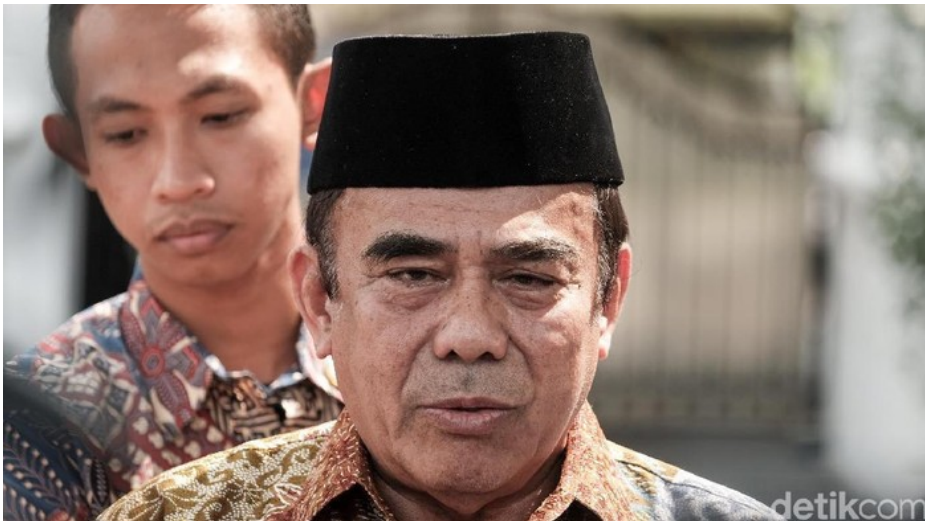
Menag Fachrul Razi

Jakarta - Menteri Agama (Menag) Fachrul Razi mengatakan Masjid Istiqlal tidak akan menggelar salat Idul Adha 1441 H tingkat kenegaraan. Alasannya, situasi pandemi virus Corona (COVID-19) di Jakarta belum berakhir.